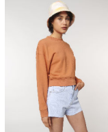
Stella Cropster Wave Terry

Shell : Terry , 85% gekämmte ringgesponnene Bio-Baumwolle , 15% recyceltes Polyester , Vorgewaschen , Weicher Griff , 300 GSM