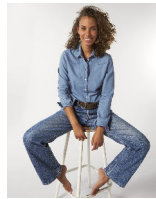
Stella Inspires Denim

Shell : Gewebt denim , 100% gekämmte ringgesponnene Bio-Baumwolle , Am Stück vorgewaschen , Yarn Dyed , 170 GSM