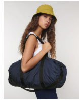
Lightweight Duffle Bag

Shell : Plain Weave , 100% recyceltes Polyester , Fluorine-free DWR , 75 GSM Lining : Taffeta , 100% recyceltes Polyester , 60 GSM