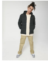
Stanley Voyager Wool-Like

Shell : Plain Weave Brushed , 100% recyceltes Polyester , Fluorine-free DWR , 140 GSM